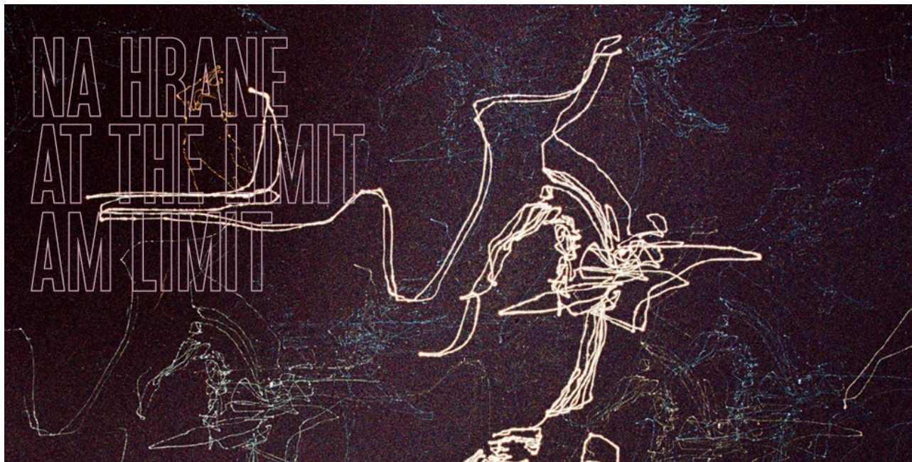
Bignia Wehrli: Písanie hviezdami, 2014, séria päťdielných obrazov, pigmentová tlač, foto: archív umelkyne