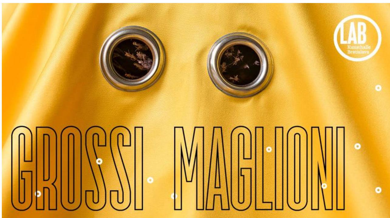
Grossi Maglioni: Occupazioni: Rozdvojené dieťa , 2019, vankúše, textilie, železo, detail inštalácie v Maďarskej akadémii v Ríme, foto: Sebastiano Luciano