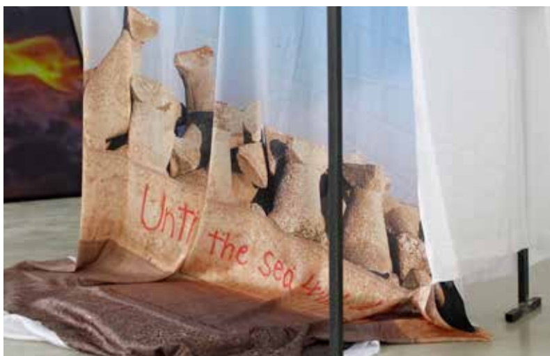
Matúš Pisarcík: Until the Sea Will Dry Up , 2020, fotografická inštalácia / photographic installation, foto / photo: Imrich Veber, autor / the artist