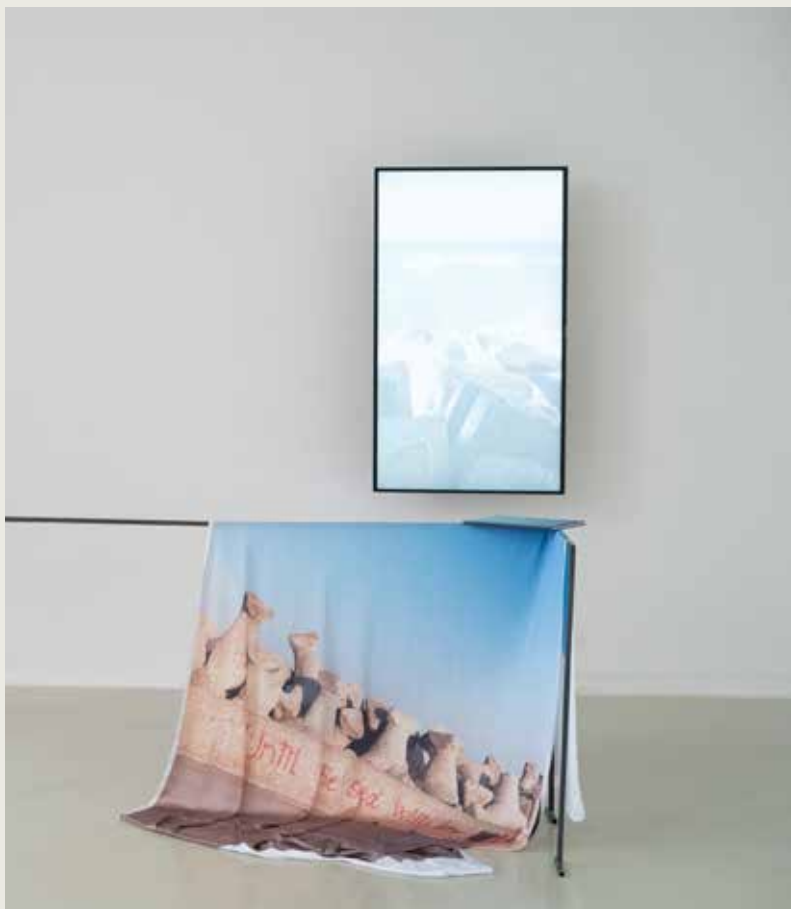
Matúš Písařík: Until the Sea Will Dry Up , 2020, fotografická inštalácia / photographic installation, foto / photo: autor / the artist