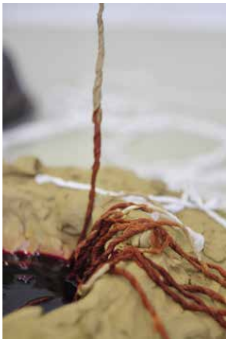
Andrea Rošková: Šedá zóna / Grey Zone, 2020, inštalácia / installation, foto / photo: Matúš Pisarčík

miznúci rozdiel medzi prácou a voľným časom. Uvažuje nad vzťahom práce a šťastia, frustrácie/motivácie a nad normami času narážajúcimi na prírodné rytmy. Ďalšou líniou, ktorej autor venuje pozornosť, je práca s fotografiou, jej „spriestornenie“, skúma jej všadeprítomnosť, možnosti a limity tohto média. Inštaláciu dopĺňajú dve menšie fotografie a dve statické spomalené videá s dohrievajúcim ohňom a s príbojom mora.