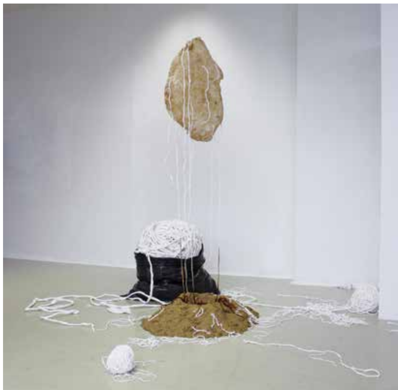
Andrea Rošková: Šedá zóna / Grey Zone , 2020, inštalácia / installation