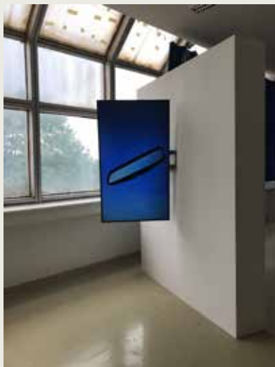
Dušan Prekop: Emocionálne krajiny / Emocional Landscapes , 2020, rôzne médiá / various media, foto / photo: autor / the artist

Dušan Prekop's installation Emotional Landscapes is an autobiographical introspective meditation on breakthroughs in the artist's inner experience of the outer world. By concentration on his own being and on Nature he moves aside from the pressurising outer social world, which for him is defined by incessant productivity, interaction, and liquid time. From feelings, relationships and everyday life he composes his subjective existential landscape, his own setting. In his work he uses transparent plate glass as a metaphor of the membrane between the inner and the outer. A striking aspect of this is stratification, overlapping, the mutual protection and mirroring of layers. The work consists of the real stand that serves for preparation of the glass and glass plates with a series of the