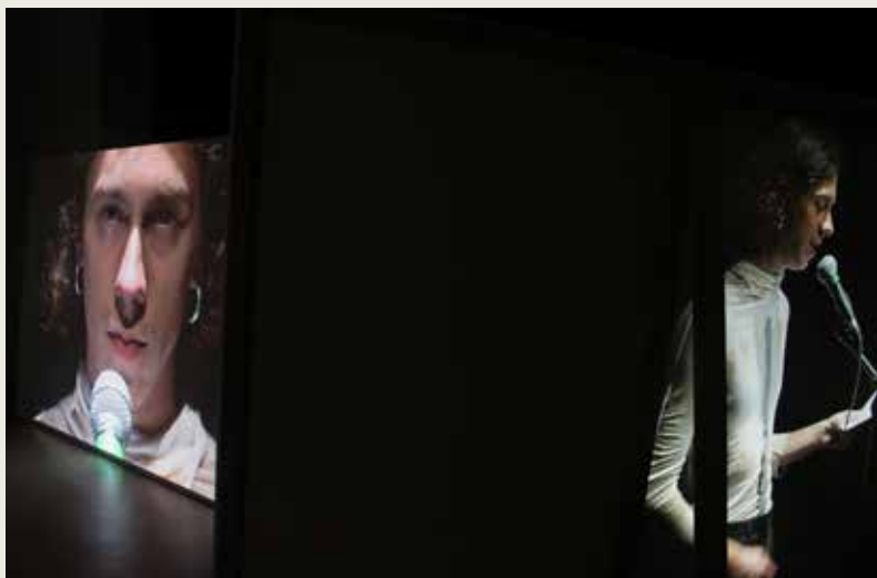
Ondřej Houšťava: Preparation for Public Hearing , 2020, 17:59 min., v spolupráci / in cooperation with: Adrian Kriška, Sanja Anđelković, Peter Zákuťanský, Matúš Pisarčík, Dávid Koronczí, foto / photo: Matúš Pisarčík

identical. Voice is lacking, and its silence is strategic. The mouth opens idly, with inconspicuous asynchronicity, to the rhythm of an unknown female voice. To engage silently is a way of prioritising “deep listening” and the inarticulable, to reject incrimination, and to define the rules of public behaviour. As Noro Lacko writes in an opponent’s assessment, this work is a study of a relatively complicated problem, namely the feasibility of constructing a different type of habitual, embodied temporality, a different chrono-politics, through a disturbance of the dominant normative historical narratives by the subversive force of queer performativity. The central theme and political gesture of the work is, simply stated, the irreducible otherness of the other.