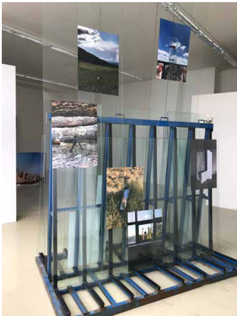
Dušan Prekop: Emocionálne krajiny / Emotional Landscapes , 2020, rôzne médiá / various media