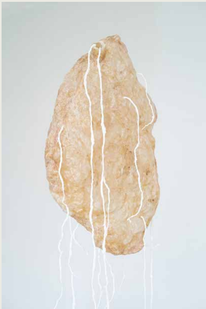
Andrea Rošková: Šedá zóna / Grey Zone , 2020, inštalácia / installation