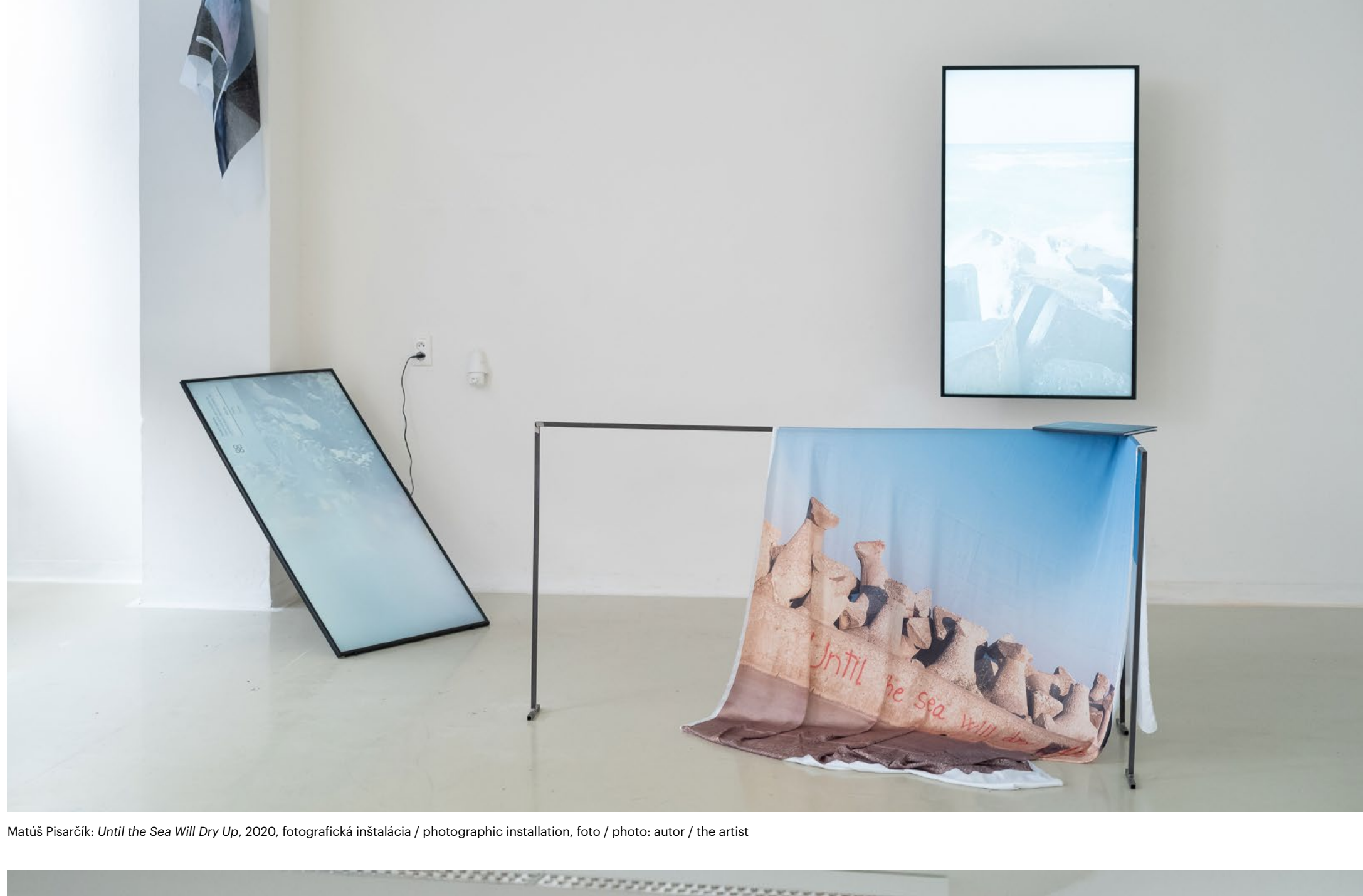
Matúš Písařík: Until the Sea Will Dry Up, 2020, fotografická inštalácia / photographic installation