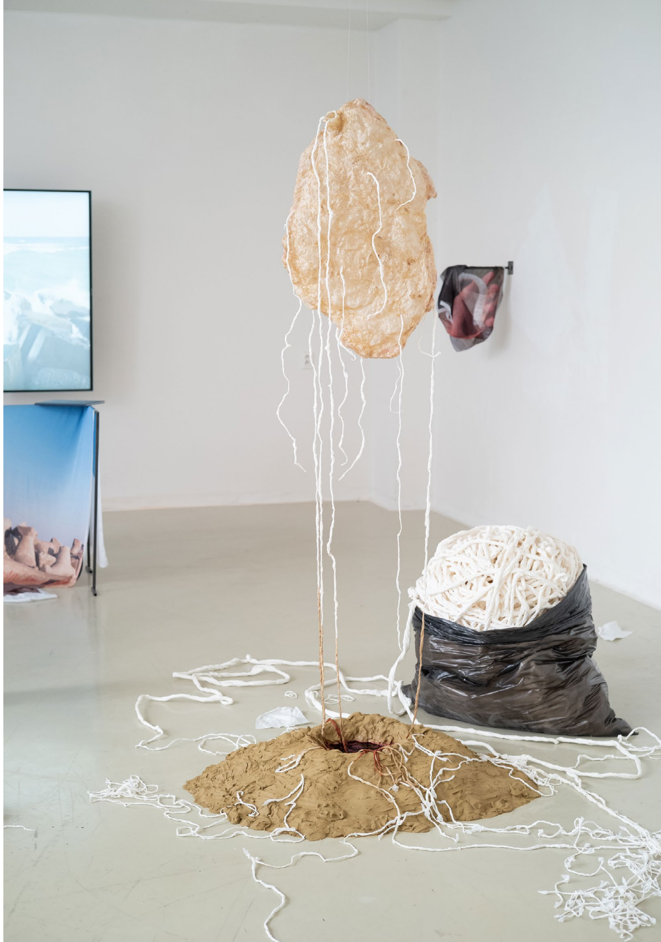
Andrea Rošková: Šedá zóna / Grey Zone, 2020, inštalácia / installation, foto / photo: Imrich Veber