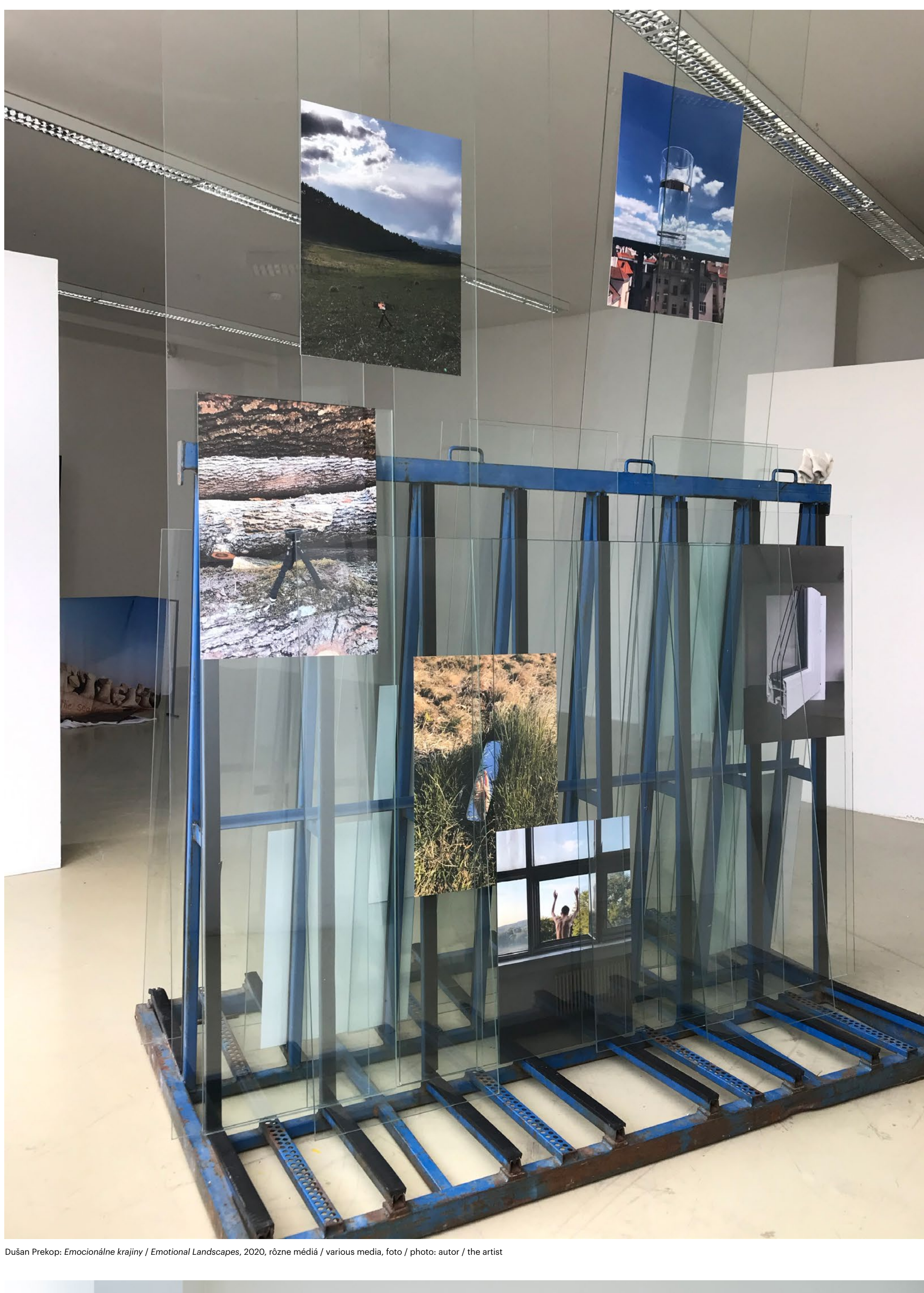
Dušan Prekop: Emocionálne krajiny / Emotional Landscapes, 2020, rôzne médiá / various media