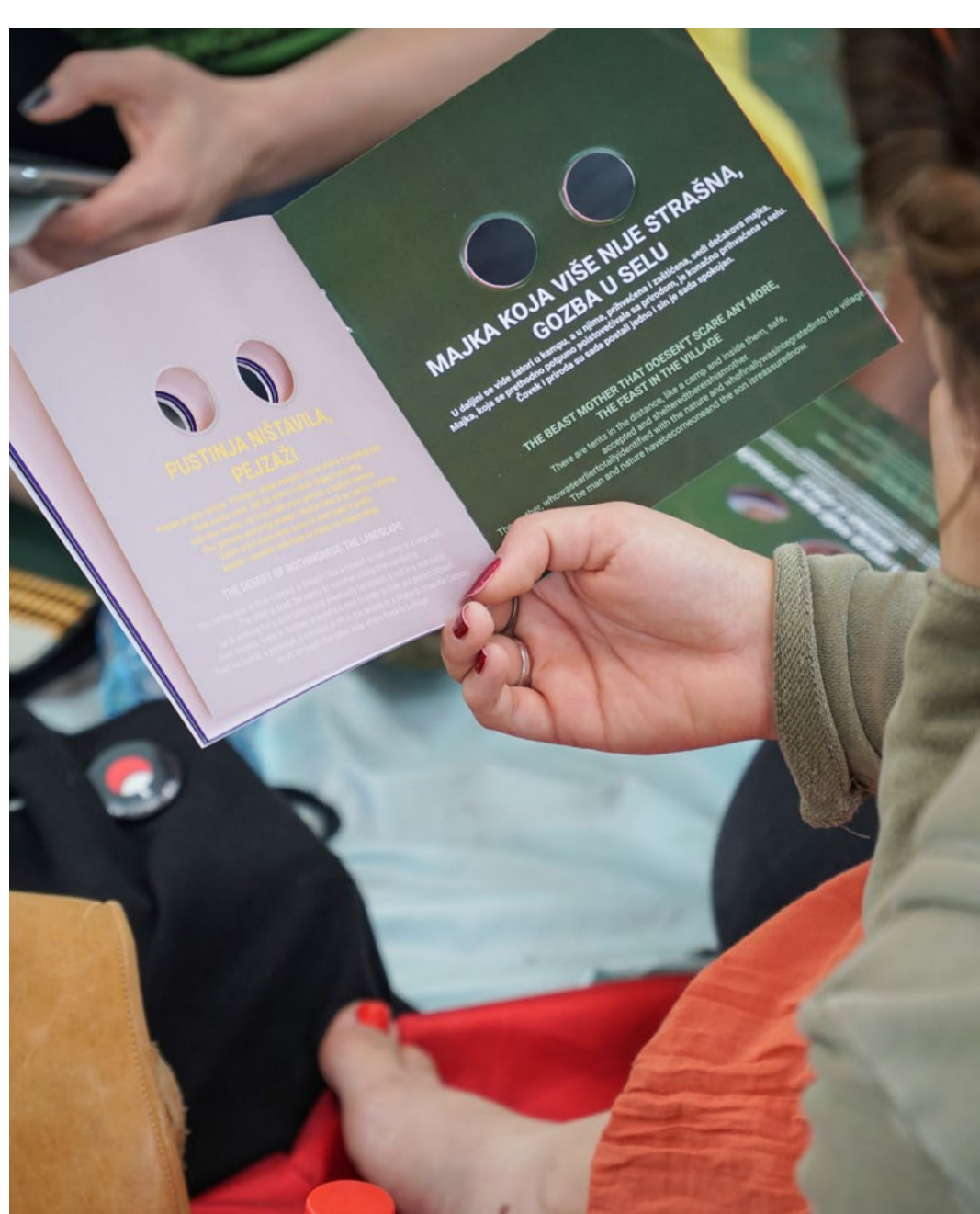
Grossi Maglioni: Occupazioni: The Perpetual Dialogue / Nepretržitý dialóg , 2018, autorská kniha / artist's book, 15 x 15 cm