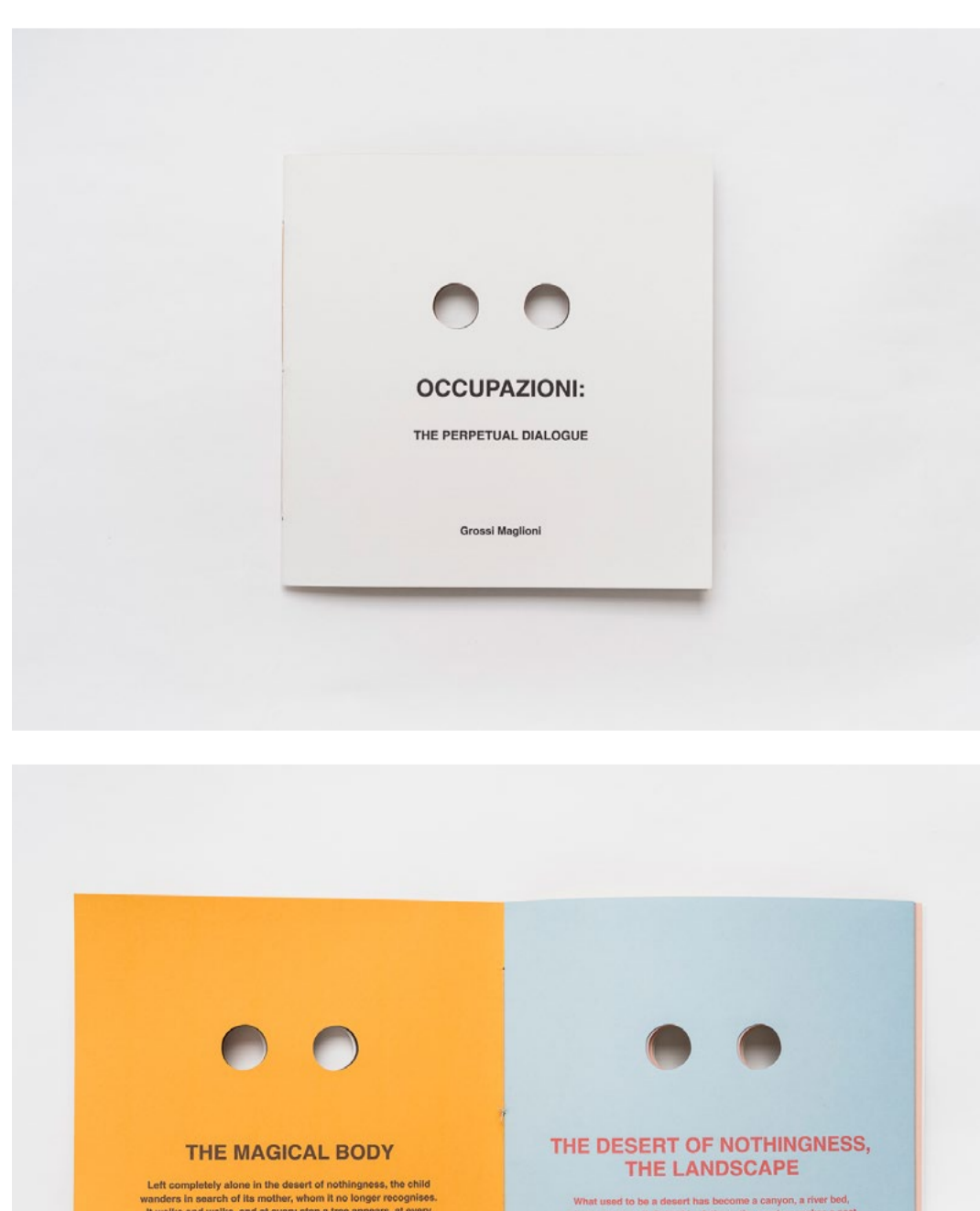
Grossi Maglioni: Occupazioni: The Perpetual Dialogue / Nepretržitý dialóg , 2021, autorská kniha / artist's book, tlač na bavlnený papier / printed on cotton paper, 23 x 23 cm