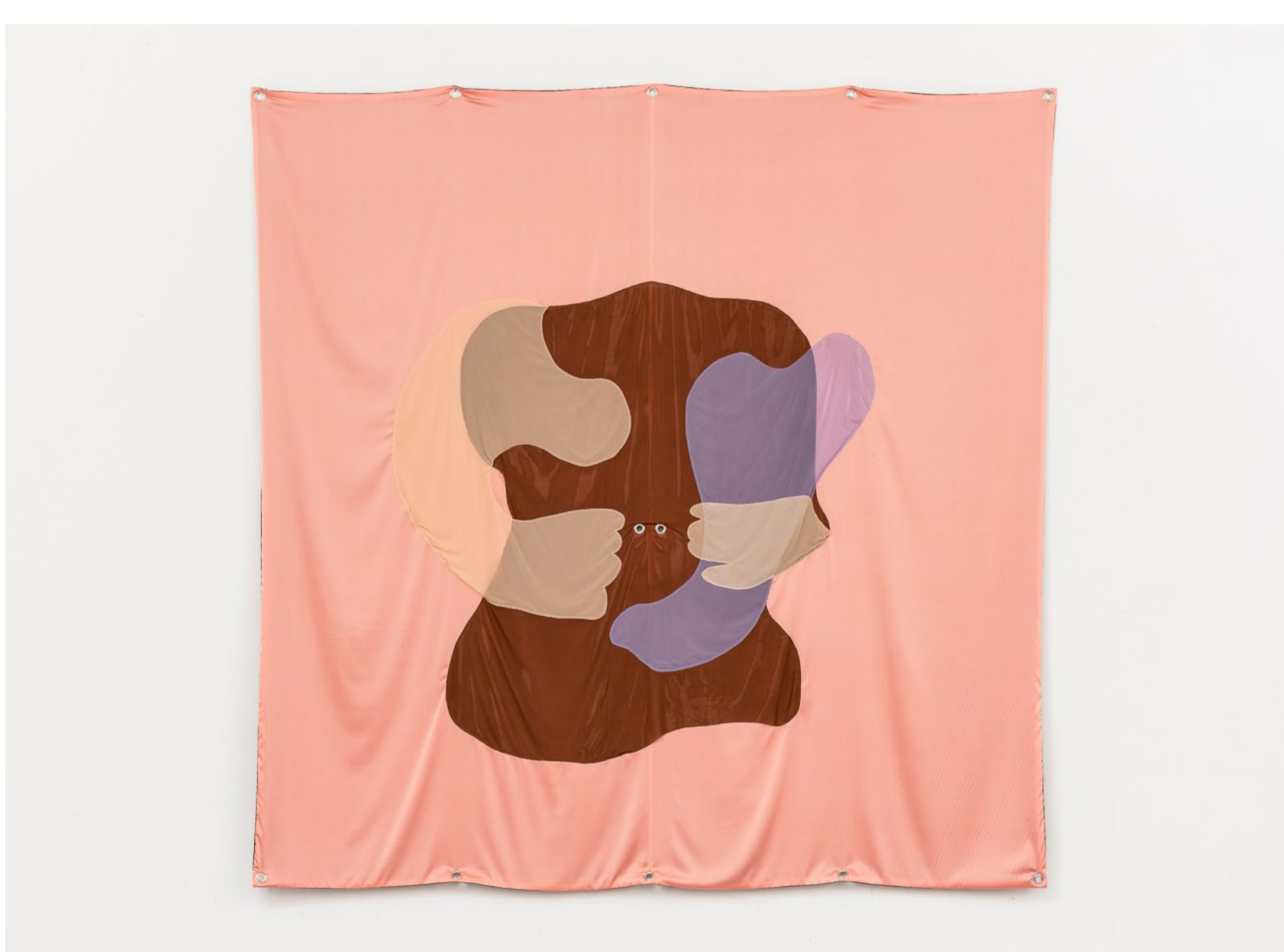
Grossi Maglioni: Occupazioni: Beast Mother / Zvieracia matka , 2021, miesto-špecifická inštalácia / site-specific installation, rôzne látky / mixed fabrics, 260 x 260 cm, foto / photo: Sebastiano Luciano