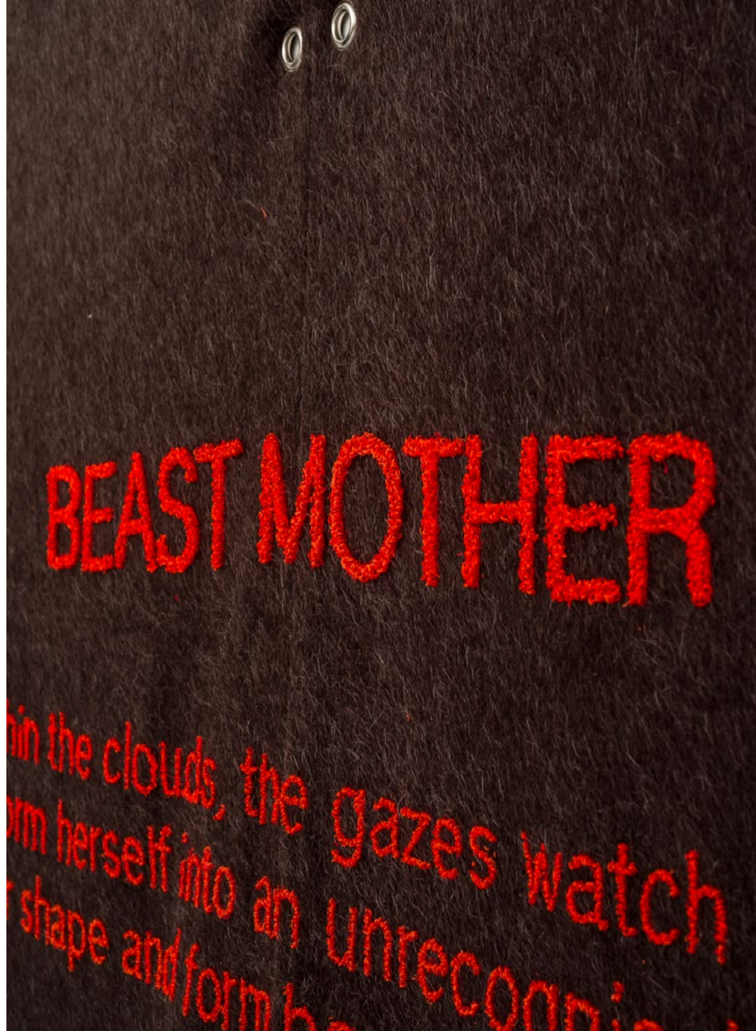
Grossi Maglioni: Occupazioni: Beast Mother / Zvieracia matka , 2021, miesto-špecifická inštalácia / site-specific installation, rôzne látky / mixed fabrics, 260 x 260 cm, foto / photo: Sebastiano Luciano