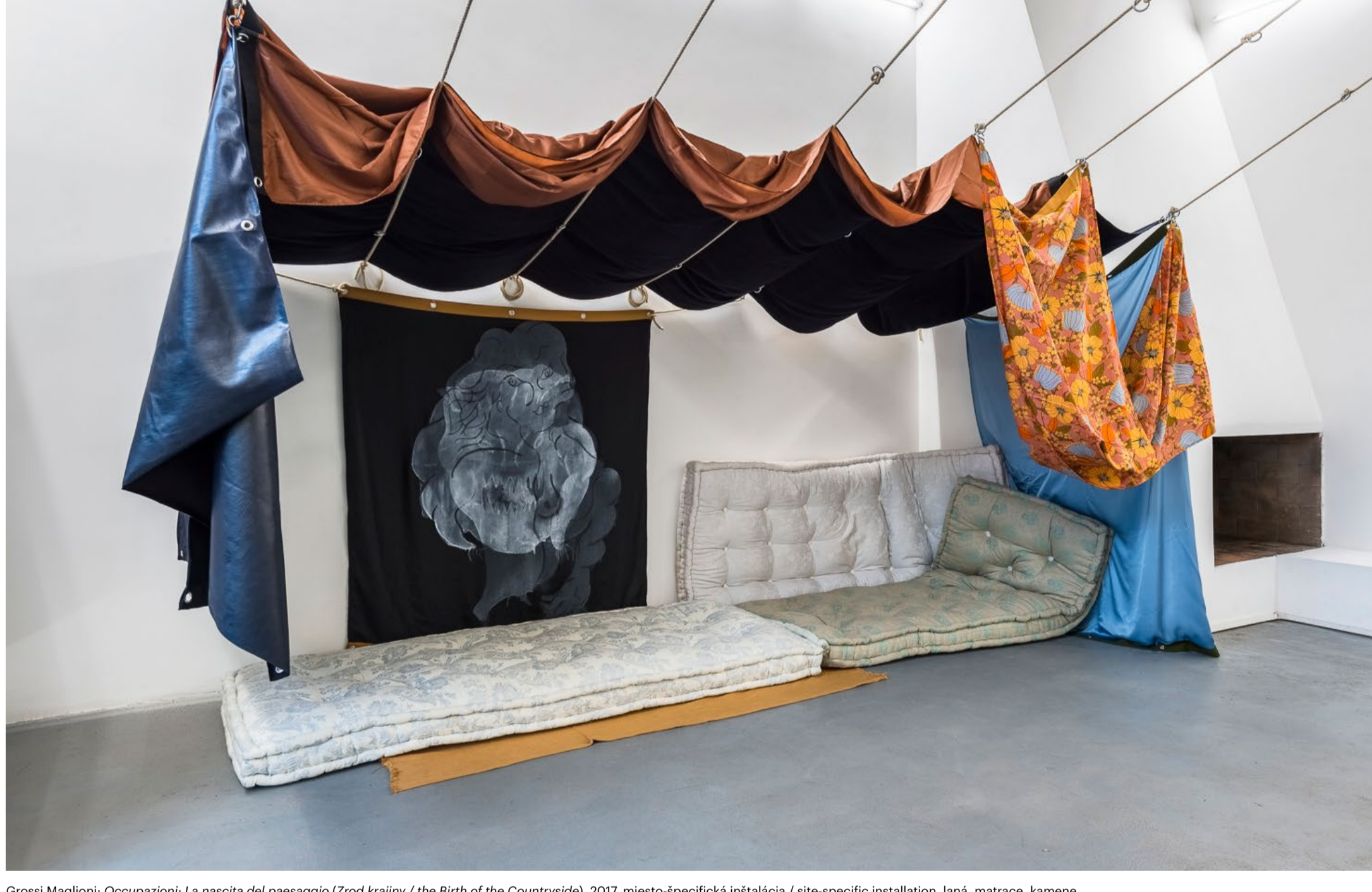
Grossi Maglioni: Occupazioni: La nascita del paesaggio (Zrod krajiny / the Birth of the Countryside) , 2017, miesto-špecifická inštalácia / site-specific installation, lána, matrace, kamene, a rôzne látky / ropes, mattresses, stones and mixed fabrics, pohľad do výstavy v AlbumArte, Rim, foto / photo: Sebastiano Luciano

Lýdia Pribišová kurátorka výstavy / exhibition curator