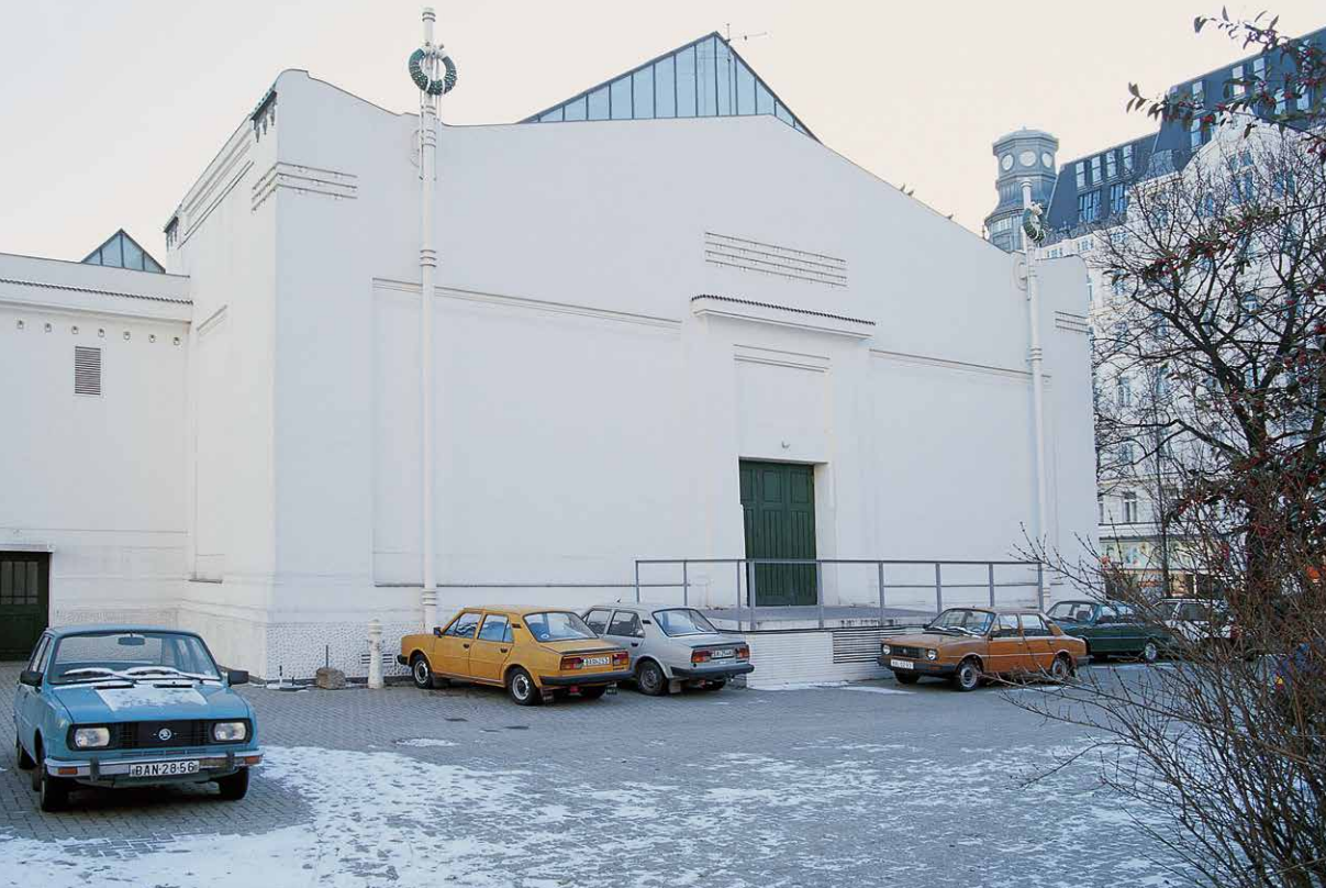
Roman Ondak: SK Parking, 2001, inštalácia, parkovisko za budovou Secession, Viedeň, foto: archív R.O.